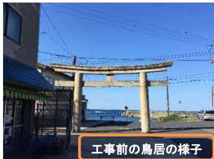
工事前の鳥居の様子

日御碕神社 神の宮鳥居の保存修理工事が令和4年11月7日～令和5年9月30日までの期間をかけて行われています。 現在、鳥居は解体・保管され、修復作業に入っている為、約1年間この鳥居の姿を観る事は出来ませんが、令和5年10月頃にはまた凛々しい鳥居の姿を観れる日を心待ちにしましょう。